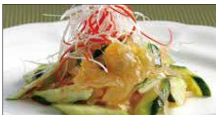
クラゲの頭と胡瓜の和え物 Sliced Jelly Fish and Cucumber with Sauce 青瓜海蜇頭

※ 滷水(ルーソイ): 醤油、八角、陳皮、甘草、月桂樹、草果(カルダモン)、中国冰糖、ネギ、生姜をベースに何年も継ぎ足し継ぎ足しを繰り返している当店自慢の滷水です。