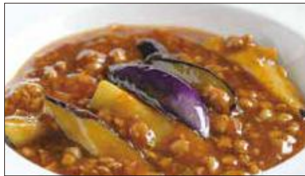
豚挽き肉と茄子の麻婆醬煮込み Stewed Eggplant with Ground Pork and Hot Sauce 香辣肉崧茄瓜