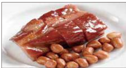
広東式チャーシュー Barbecued Pork 蜜汁叉焼