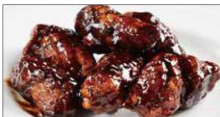
黒酢のすぶた Fried Pork with Chinese Vinegar Sauce 黒醋古老肉