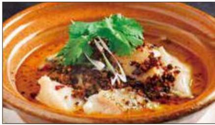
白身魚の水煮 (サイズウ)※ Sichuan Boiled Fish 水煮魚