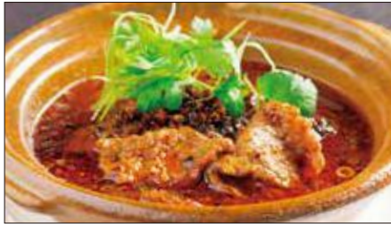
牛肉の水煮 (サイズウ)※ Sichuan Boiled Beef 水煮牛肉

Tax Included 税込 表示価格にサービス料 10%を別途頂戴いたします