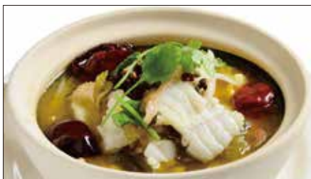
白身魚と漬け菜、唐辛子の煮込み Boiled Fish with Pickled Vegetable and Chili 酸菜魚