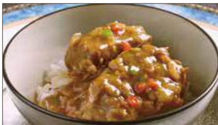
牛スネ肉のカレーあんかけご飯 Rice with Beef Curry 咖哩牛脛飯