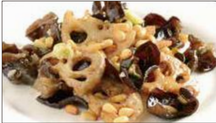
黒キクラゲ、蓮根、松の実の炒め 687 Sauteed Judas's-ear and Lotus and pine nut 木耳炒蓮藕