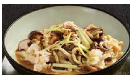
色々きのこの伊府麵、トリュフオイルの香り Stewed Noodles with Various Mushroom, Truffle Oil 松露油什菇伊麵