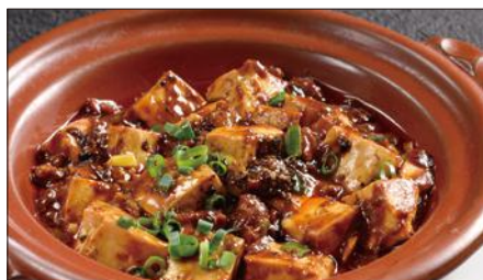
四川マーボー豆腐の土鍋煮込み Braised Tofu with Hot & Spicy Sauce 麻婆豆腐