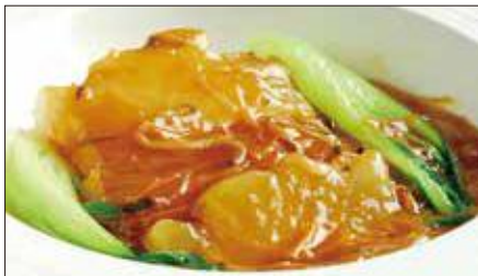
冬瓜の干し貝柱あんかけ 1,178 Wax gourd with Dried scallop starchy sauce 干貝扒冬瓜