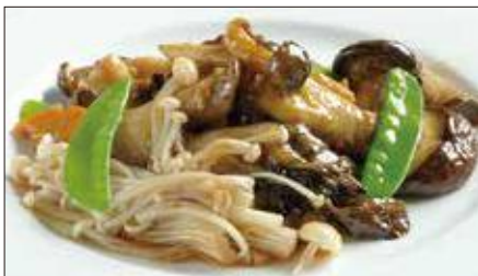
色々きのこのオイスターソース炒め 1,276 Sauteed Mushrooms with Oyster Sauce 蠔油炒野菌