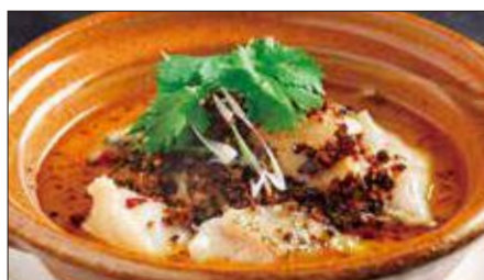
白身魚の水煮 (サイズウ)※ Sichuan Boiled Fish 水煮魚