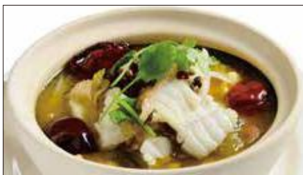
白身魚と漬け菜、唐辛子の煮込み 2,356 Boiled Fish with Pickled Vegetable and Chili 酸菜魚