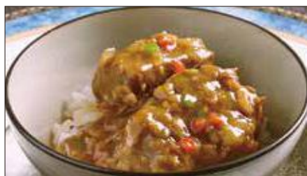
牛スネ肉のカレーあんかけご飯 Rice with Beef Curry 咖哩牛脛飯