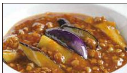
豚挽き肉と茄子の麻婆醬煮込み Stewed Eggplant with Ground Pork and Hot Sauce 香辣肉崧茄瓜