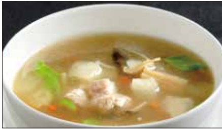
冬瓜と鶏肉、蟹肉、干し貝柱入りスープ 1,767 Soup with Wax Gourd, Chicken, Crab Meat, and Dried Scallops 冬瓜什錦湯

Tax Included 税込 表示価格にサービス料 10%を別途頂戴いたします