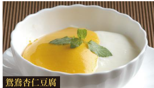
マンゴー杏仁豆腐

豆乳でコクをプラスした当店オリジナル豆乳杏仁豆腐。ヘルシーで女性の方にも人気です。