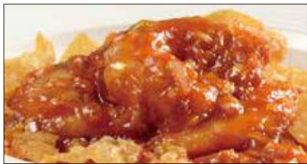
海老のチリソース Sauteed Peeled Shrimp with Chili Sauce 干焼蝦仁