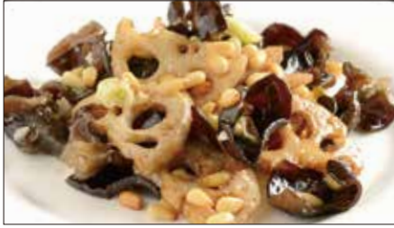
黒キクラゲ、蓮根、松の実の炒め Sauteed Judas's-ear and Lotus and pine nut 木耳炒蓮藕

Tax Included 税込 表示価格にサービス料 10%を別途頂戴いたします