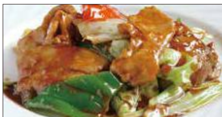
ホイコーロウ Sauteed Vegetables with Pork 回鍋肉