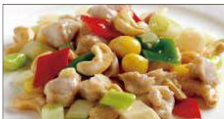
鶏肉とカシューナッツの炒め Sauteed Chicken and Cashew nut 腰果鶏丁