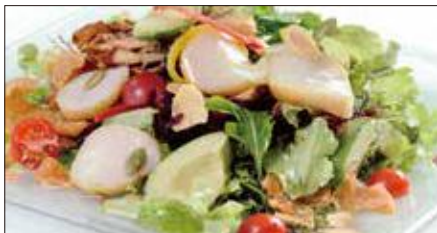
シェフサラダ (帆立貝) Smoked Scallop and Avocado and Mushrooms Salad 厨長扇貝沙律

燻製海老、ミックスベビーリーフ、ミニレタス、スプラウト、アボカド、ミニトマト、エリンギ、舞茸、パプリカ、フライドガーリック、揚げワントン皮、ミックスナッツ (カボチャの種、アーモンドスライス、松の実)