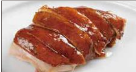
国産鶏肉の ルーソイ ※ 煮込み Boiled Chicken in Homemade Sauce 玫瑰油鶏