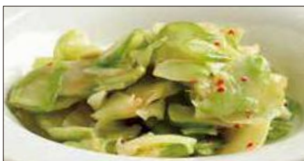
浅漬けザーサイ Pickled Sichuan Vegetables 鮮榨菜