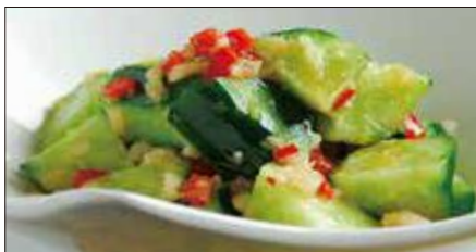
胡瓜の麻辣ニンニクソース和え Sliced Cucumber with Garlic and Hot Sauce 麻辣拌青瓜

燻製帆立貝、ミックスベビーリーフ、ミニレタス、スプラウト、アボカド、ミニトマト、エリンギ、舞茸、パプリカ、フライドガーリック、揚げワントン皮、ミックスナッツ (カボチャの種、アーモンドスライス、松の実)