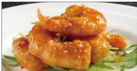
海老の マラー 麻辣ソース Sauteed Peeled Shrimp with Hot Sauce 麻辣蝦仁