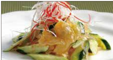
クラゲの頭と胡瓜の和え物 Sliced Jelly Fish and Cucumber with Sauce 青瓜海蜇頭

※ 滷水(ルーソイ): 醤油、八角、陳皮、甘草、月桂樹、草果(カルダモン)、中国冰糖、ネギ、生姜をベースに何年も継ぎ足し継ぎ足しを繰り返している当店自慢の滷水です。