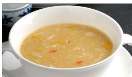
蟹肉入りコーンスープ Corn Soup with Crab Meat 蟹肉粟米湯