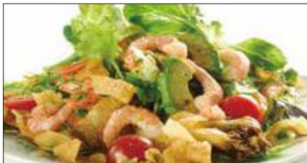
シェフサラダ (海老) Smoked Shrimp and Avocado and Mushrooms Salad 厨長蝦仁沙律