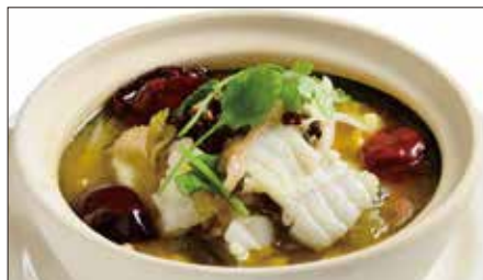
白身魚と漬け菜、唐辛子の煮込み 2,356 Boiled Fish with Pickled Vegetable and Chili 酸菜魚

Tax Included 税込 表示価格にサービス料 10%を別途頂戴いたします