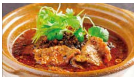
牛肉の水煮 (サイズウ)※ 1,964 Sichuan Boiled Beef 水煮牛肉