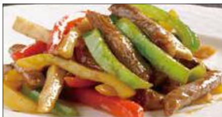
国産牛のチンジャオニューロース Sauteed Japanese Beef with Paprika 彩椒牛肉条