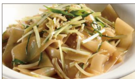
もやしと黄ニラの河粉 * (ホーフアン)炒め Rice Noodles with Bean Sprouts and Yellow Chive 豆芽炒河粉