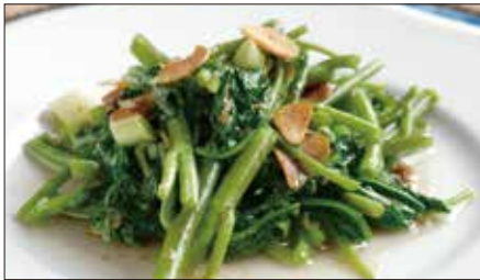
空心菜の馬拉醬炒め Stir Fried Water Spinach with Belachan Sauce 馬拉醬炒通菜