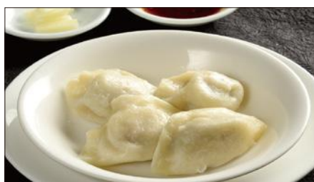
水ぎょうぎ、生ニンニク添え Boiled Jiaozi Stuffed with Pork and Vegetables 水餃子