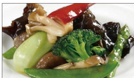
八種野菜のトリュフオイル炒め Sauteed Vegetables with Truffle Oil 松露油季節菜

麻山椒は花椒(ホアジャオ)と呼ばれる四川省産の青山椒のことで、爽やかで鼻にぬける強い香りが特徴です。