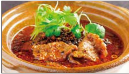
牛肉の水煮 (スイズウ)※ Sichuan Boiled Beef 水煮牛肉