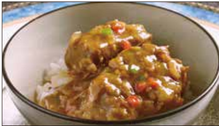
牛スネ肉のカレーあんかけご飯 Rice with Beef Curry 咖哩牛脛飯