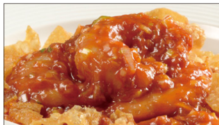
海老のチリソース Sauteed Peeled Shrimp with Chili Sauce 干焼蝦仁