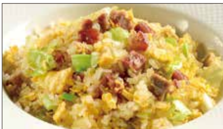
チャーシューとレタスのコンニャク米 チャーハン 1,767 Stir-fried Small Konjak boll with Roasted Pork and Lettuce 叉焼炒蒟蒻米