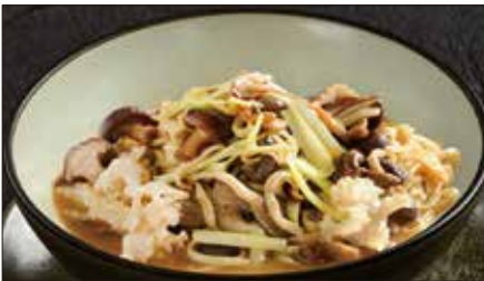
色々きのこの伊府麵、トリュフオイルの香り 1,178 Stewed Noodles with Various Mushroom, Truffle Oil 松露油什菇伊麵