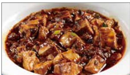
麻山椒*入りマーボー豆腐 Braised Tofu with Hot & Sichuan Pepper Sauce 聘珍麻辣豆腐