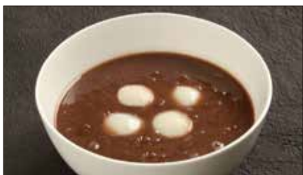
白玉団子入り陳皮香る小豆のお汁粉 1,300 Glutinous Rice Balls with Red Bean paste 紅豆沙湯圓

お米の代用品で、コンニャクを米粒大にした加工品。コンニャクは不溶性食物繊維が豊富で、腸内の濁物を体外へ排出させる作用に優れています。