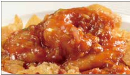
海老のチリソース Sauteed Peeled Shrimp with Chili Sauce 干焼蝦仁