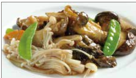
色々きのこのオイスターソース炒め Sauteed Mushrooms with Oyster Sauce 蠔油炒野菌