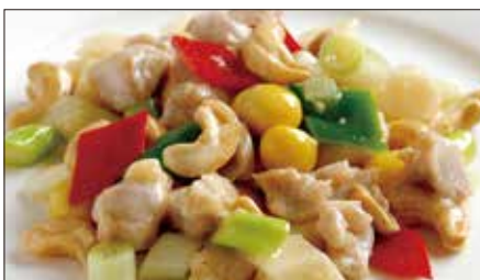
鶏肉とカシューナッツの炒め Sauteed Chicken and Cashew nut 腰果雞丁