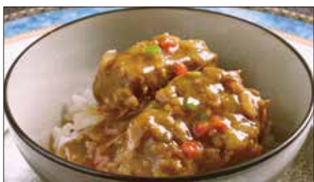
牛スネ肉のカレーあんかけご飯 Rice with Beef Curry 咖哩牛脛飯