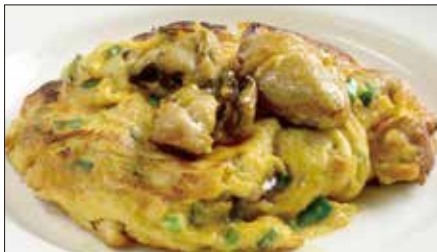
牡蠣とニラ、玉子の香り焼き Pan-fried Oyster and Chinese Chives and Egg 韭菜煎蠔仔餅