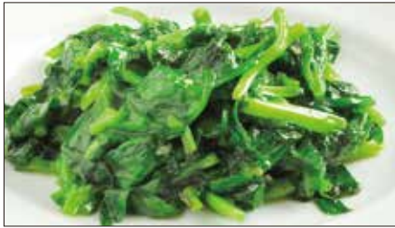
豆苗の塩炒め Sauteed Bean Seedling 清炒豆苗