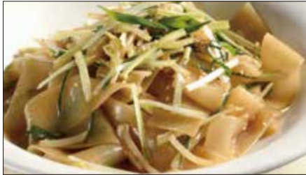
もやしと黄ニラの河粉 ※ (ホーフアン)炒め Rice Noodles with Bean Sprouts and Yellow Chive 豆芽炒河粉