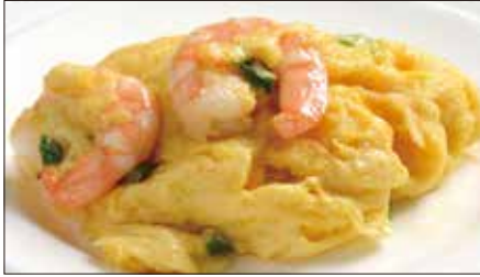
海老と玉子の炒め Sauteed Peeled Shrimp and Egg 滑蛋蝦仁