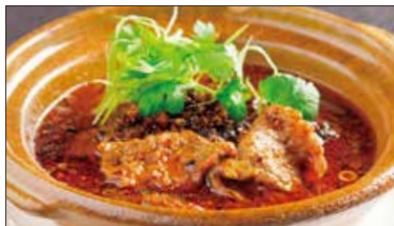
牛肉の水煮 (スイズウ)※ Sichuan Boiled Beef 水煮牛肉