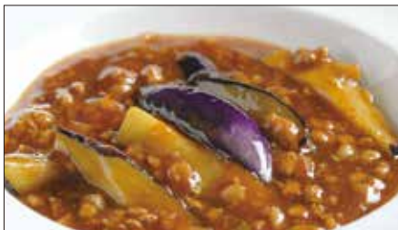
豚挽き肉と茄子の麻婆醬煮込み Stewed Eggplant with Ground Pork and Hot Sauce 香辣肉崧茄瓜