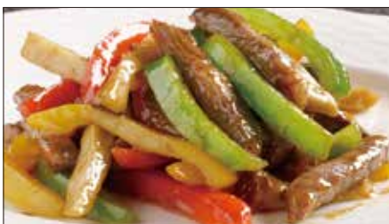
国産牛のチンジャオニューロース Sauteed Japanese Beef with Paprika 彩椒牛肉条