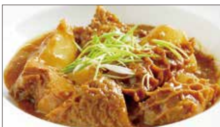
国産牛ハチノスと大根の沙茶醬煮込み Stewed Beef Tripe and Japanese White Radish 沙茶牛肚煲 with Shacha Sauce