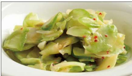
浅漬けザーサイ Pickled Sichuan Vegetables 鮮榨菜