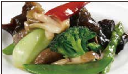
八種野菜のトリュフオイル炒め Sauteed Vegetables with Truffle Oil 松露油季節菜