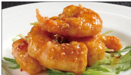
海老の麻辣 (マーラー) ソース Sauteed Peeled Shrimp with Hot Sauce 麻辣蝦仁