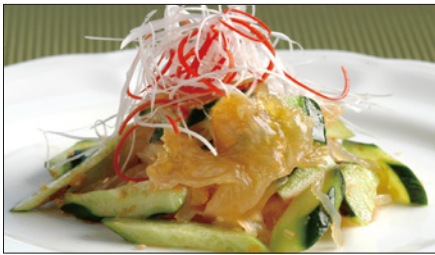
クラゲの頭と胡瓜の和え物 Sliced Jelly Fish and Cucumber with Sauce 青瓜海蜇頭