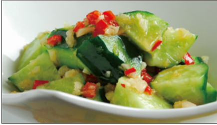
胡瓜の麻辣 (マーラー) ニンニクソース和え Sliced Cucumber with Garlic and Hot Sauce 麻辣拌青瓜