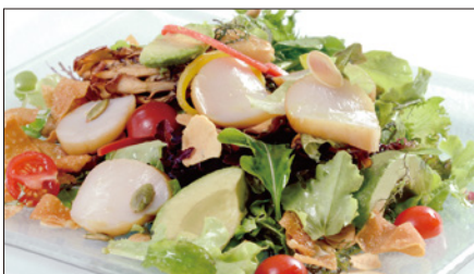
シェフサラダ (帆立貝) Smoked Scallop and Avocado and Mushrooms Salad 厨長扇貝沙律

燻製海老、ミックスベビーリーフ、ミニレタス、スプラウト、アボカド、ミニトマト、エリンギ、舞茸、パプリカ、フライドガーリック、揚げワンタン皮 ミックスナッツ (カボチャの種、アーモンドスライス、松の実)