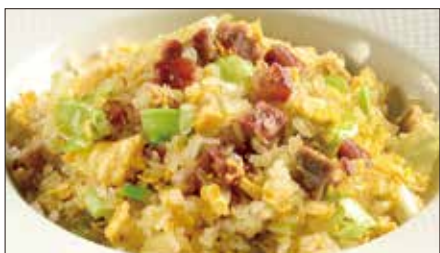
チャーシューとレタスのコンニャク米 ※ チャーハン Stir-fried Small Konjak boll with Roasted Pork and Lettuce 叉焼炒蒟蒻米