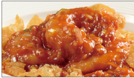
海老のチリソース Sauteed Peeled Shrimp with Chili Sauce 干焼蝦仁