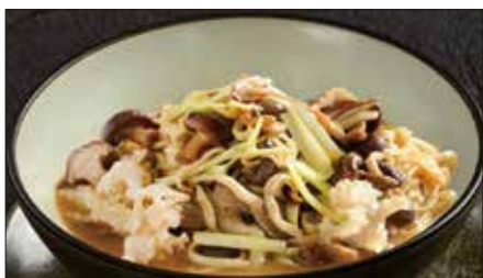
色々きのこの伊府麵、トリュフオイルの香り Stewed Noodles with Various Mushroom, Truffle Oil 松露油什菇伊麵