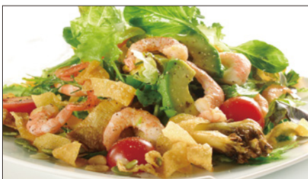
シェフサラダ (海老) Smoked Shrimp and Avocado and Mushrooms Salad 厨長蝦仁沙律