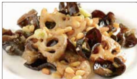
黒キクラゲ、蓮根、松の実の炒め Sauteed Judas's-ear and Lotus and Pine nut 木耳炒蓮藕