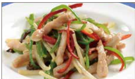
チンジャオロース (豚肉) Sauteed Pork with Sweet Pepper 青椒肉絲