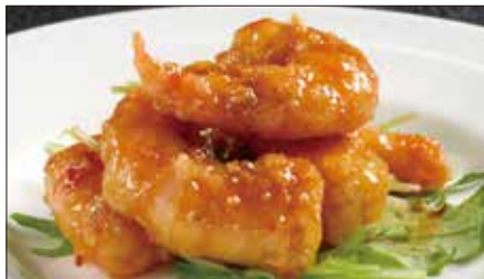
海老の麻辣 (マーラー) ソース Sauteed Peeled Shrimp with Hot Sauce 麻辣蝦仁