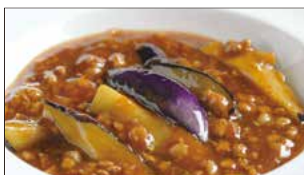
豚挽き肉と茄子の麻婆醬煮込み Stewed Eggplant with Ground Pork and Hot Sauce 香辣肉崧茄瓜