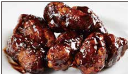
黒酢のすぶた Fried Pork with Chinese Vinegar Sauce 黒醋古老肉