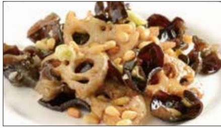
黒キクラゲ、蓮根、松の実の炒め Sauteed Judas's-ear and Lotus and Pine nut 木耳炒蓮藕