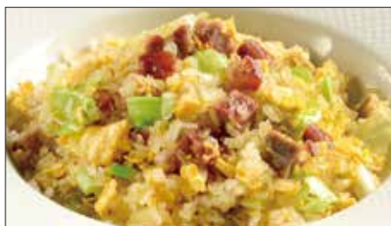
※ チャーシューとレタスのコンニャク米 チャーハン Stir-fried Small Konjak boll with Roasted Pork and Lettuce 叉焼炒蒟蒻米