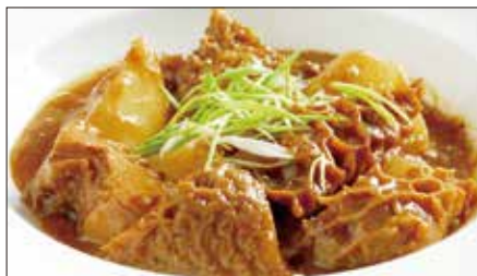
国産牛ハチノスと大根の沙茶醬煮込み Stewed Beef Tripe and Japanese White Radish with Shacha Sauce 沙茶牛肚煲