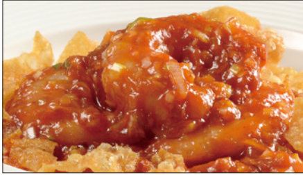
海老のチリソース Sauteed Peeled Shrimp with Chili Sauce 干焼蝦仁