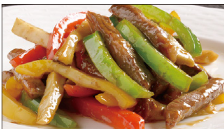
国産牛のチンジャオニューロース Sauteed Japanese Beef with Paprika 彩椒牛肉条