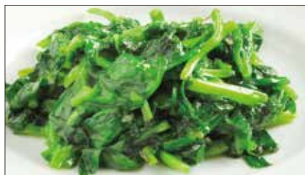
豆苗の塩炒め Sauteed Bean Seedling 清炒豆苗