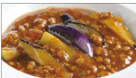
豚挽き肉と茄子の麻婆醬煮込み Stewed Eggplant with Ground Pork and Hot Sauce 香辣肉崧茄瓜