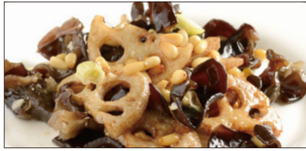
黒キクラゲ、蓮根、松の実の炒め Sauteed Judas's-ear and Lotus and Pine nut 木耳炒蓮藕