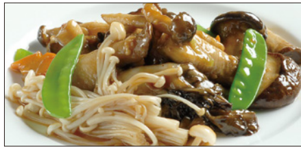
色々きのこのオイスターソース炒め Sauteed Mushrooms with Oyster Sauce 蠔油炒野菌