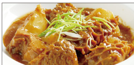
国産牛ハチノスと大根の沙茶醬煮込み Stewed Beef Tripe and Japanese White Radish with Shacha Sauce 沙茶牛肚煲