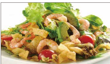
シェフサラダ (海老) Smoked Shrimp and Avocado and Mushrooms Salad 厨長蝦仁沙律