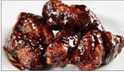
黒酢のすぶた Fried Pork with Chinese Vinegar Sauce 黒醋古老肉