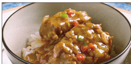
牛スネ肉のカレーあんかけご飯 Rice with Beef Curry 咖哩牛脛飯