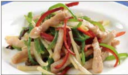
チンジャオロース (豚肉) Sauteed Pork with Sweet Pepper 青椒肉絲