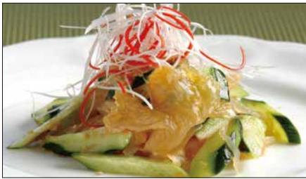
クラゲの頭と胡瓜の和え物 Sliced Jelly Fish and Cucumber with Sauce 青瓜海蜇頭