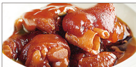
豚足、生姜の黒酢煮込み Stewed Pork Trotter with Black Vinegar 浙醋姜猪脚