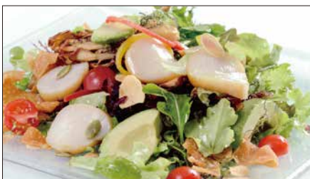
シェフサラダ (帆立貝) Smoked Scallop and Avocado and Mushrooms Salad 厨長扇貝沙律

燻製海老、ミックスベビーリーフ、ミニレタス、スプラウト、アボカド、ミニトマト、エリンギ、舞茸、パプリカ、フライドガーリック、揚げワンタン皮、ミックスナッツ (カボチャの種、アーモンドスライス、松の実)