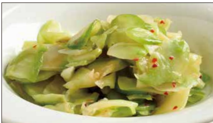
浅漬けザーサイ Pickled Sichuan Vegetables 鮮榨菜