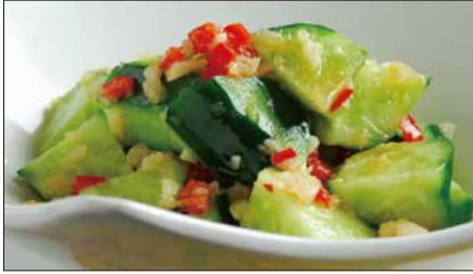
胡瓜の麻辣 (マーラー) ニンニクソース和え Sliced Cucumber with Garlic and Hot Sauce 麻辣拌青瓜