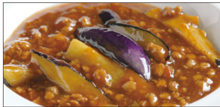
豚挽き肉と茄子の麻婆醬煮込み Stewed Eggplant with Ground Pork and Hot Sauce 香辣肉崧茄瓜