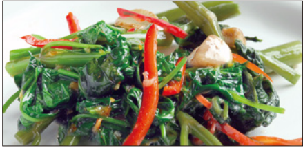
空心菜の馬拉醬炒め Stir Fried Water Spinach with Malay sauce 馬拉炒通菜