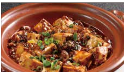
四川マーボー豆腐の土鍋煮込み Braised Tofu with Hot & Spicy Sauce 麻婆豆腐