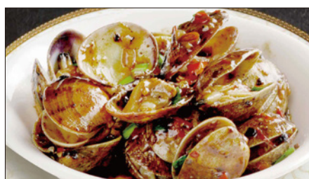
あさりと春雨の豆豉醬 (トウチジャン) 煮込み Stewed Clams and Bean-Starch Vermicelli with Black Bean Sauce 豆豉粉絲鮮蜆