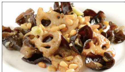
黒キクラゲ、蓮根、松の実の炒め Sauteed Judas's-ear and Lotus and Pine nut 木耳炒蓮藕