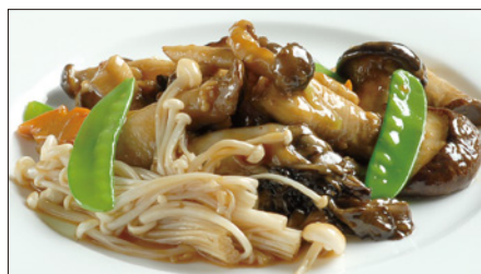
色々きのこのオイスターソース炒め Sauteed Mushrooms with Oyster Sauce 蠔油炒野菌