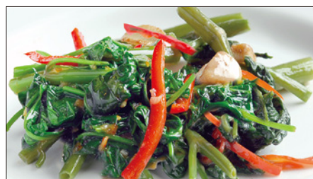
空心菜の馬拉醬炒め Stir Fried Water Spinach with Malay sauce 馬拉炒通菜