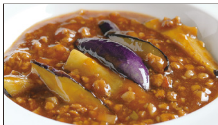
豚挽き肉と茄子の麻婆醬煮込み Stewed Eggplant with Ground Pork and Hot Sauce 香辣肉崧茄瓜